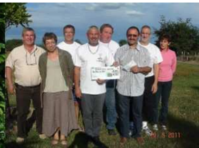
Remise chèque Craitilleux