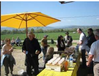
Marche de Biterne