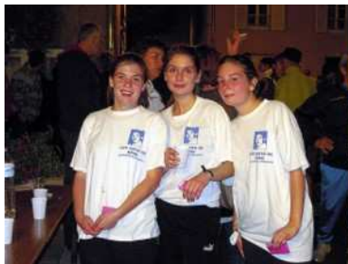
Course de la fourme