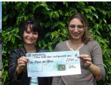
Remise chèque des Olympiades