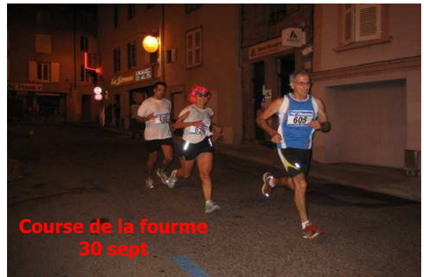
Course de la fourme 30 sept