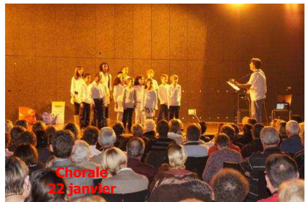
Chorale 22 janvier