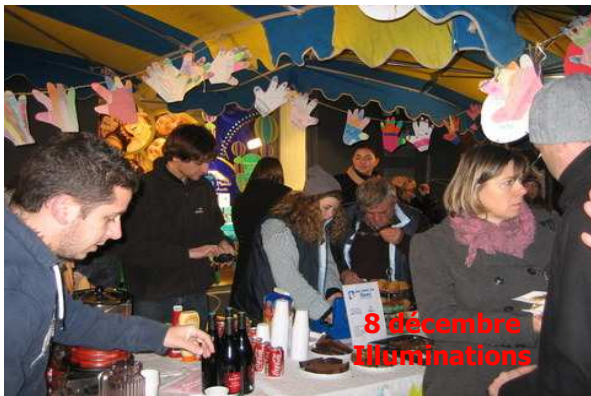
8 décembre Illuminations