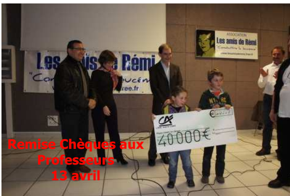
Remise Chèques aux Professeurs 13 avril