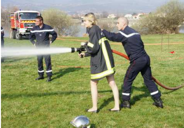
Rendez vous le 24 mars 2013