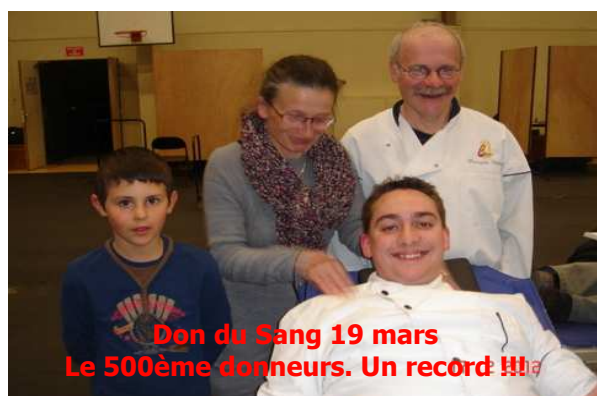
Don du Sang 19 mars Le 500ème donneurs. Un record !!!

Prochains dons du sang 19/11/12 et 18/03/13