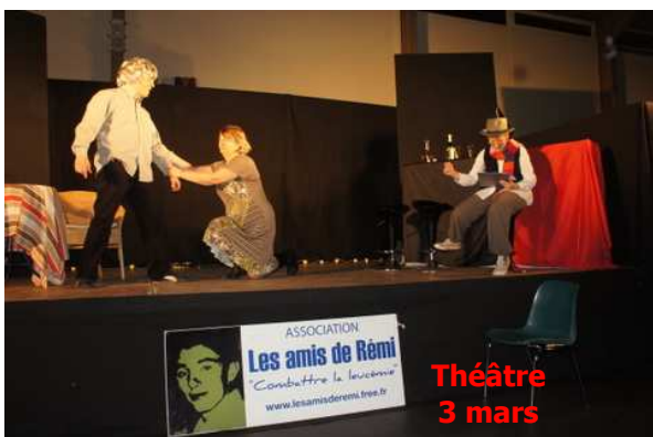
Théâtre 3 mars

Prochains dons du sang 19/11/12 et 18/03/13